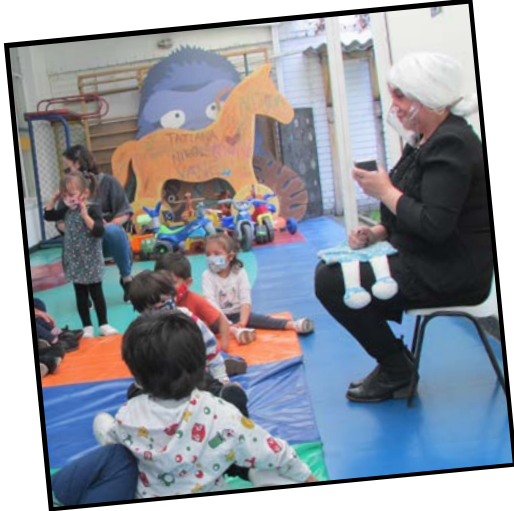
Conociendo a la tía Mechás