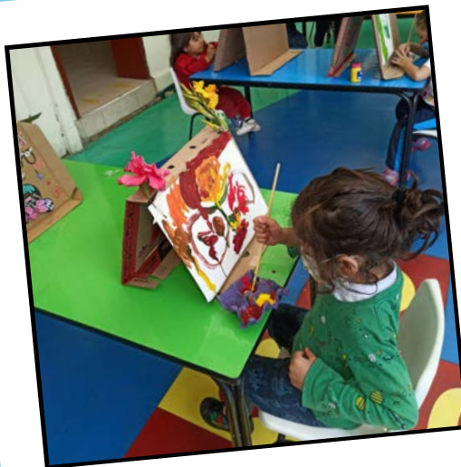
Arte de exteriores