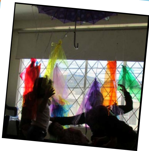
¡Que llueva, que llueva!