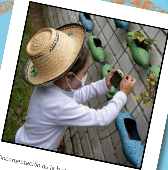
Documentación de la huerta