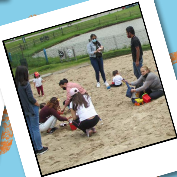
El gran reencuentro