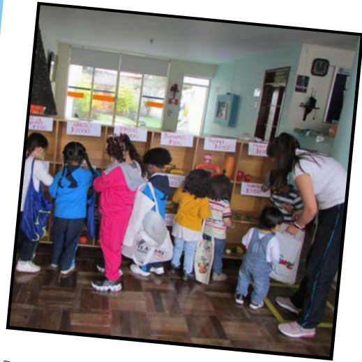
De compras en el super