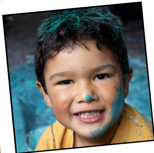
Colores y emociones