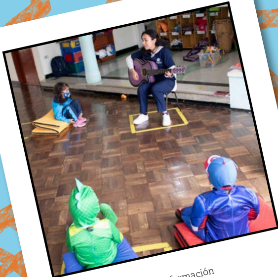
Canciones y maestras en formación