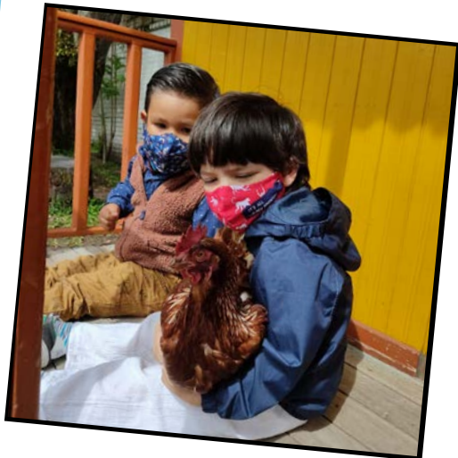
Compartiendo con las gallinas