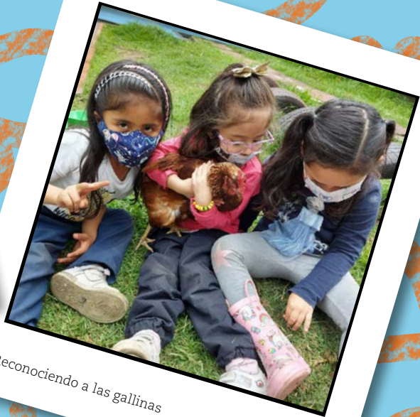
Reconociendo a las gallinas