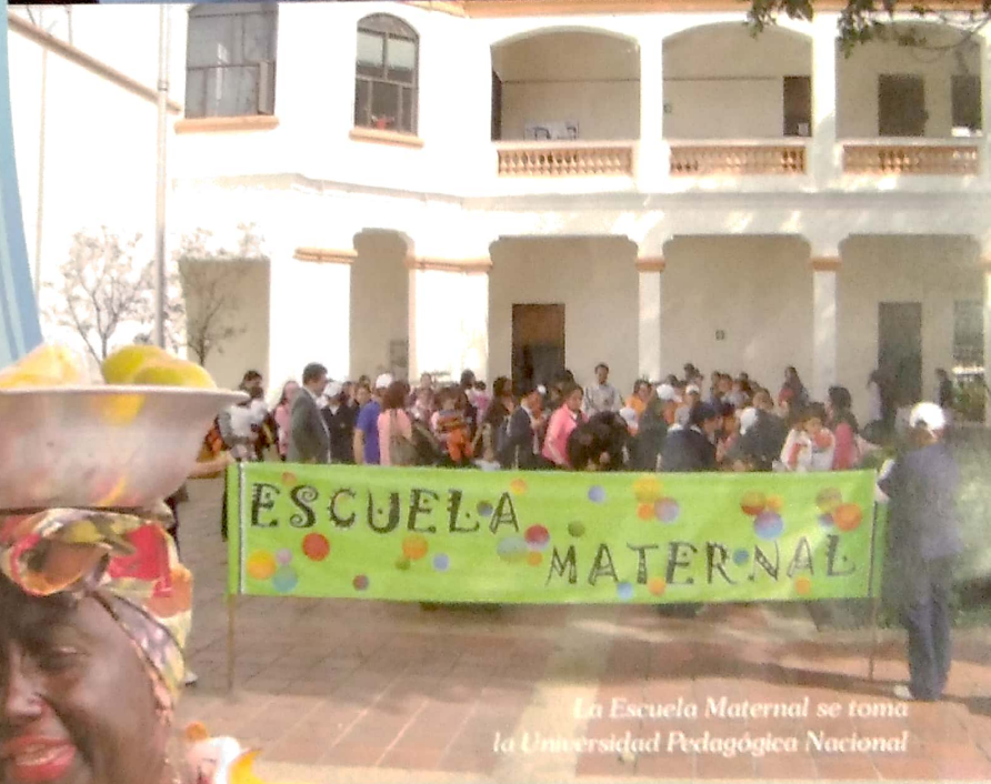
La Escuela Maternal se toma la Universidad Pedagógica Nacional