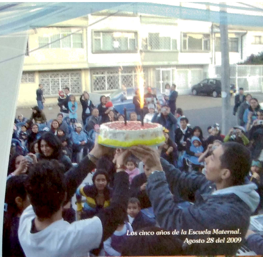
Los cinco años de la Escuela Maternal. Agosto 28 del 2009