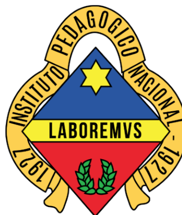
Figura 2. Escudo IPN