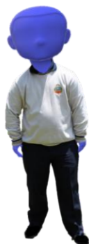
Figura 7. Uniforme 1.