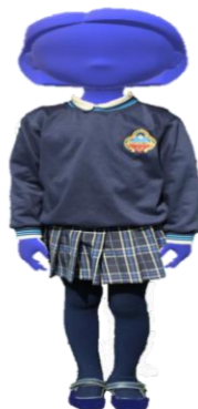
Figura 8. Uniforme 2.